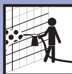
Verarbeitung mittels Schaumkanone