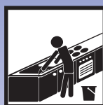
Manuelle Verarbeitung im Küchenbereich